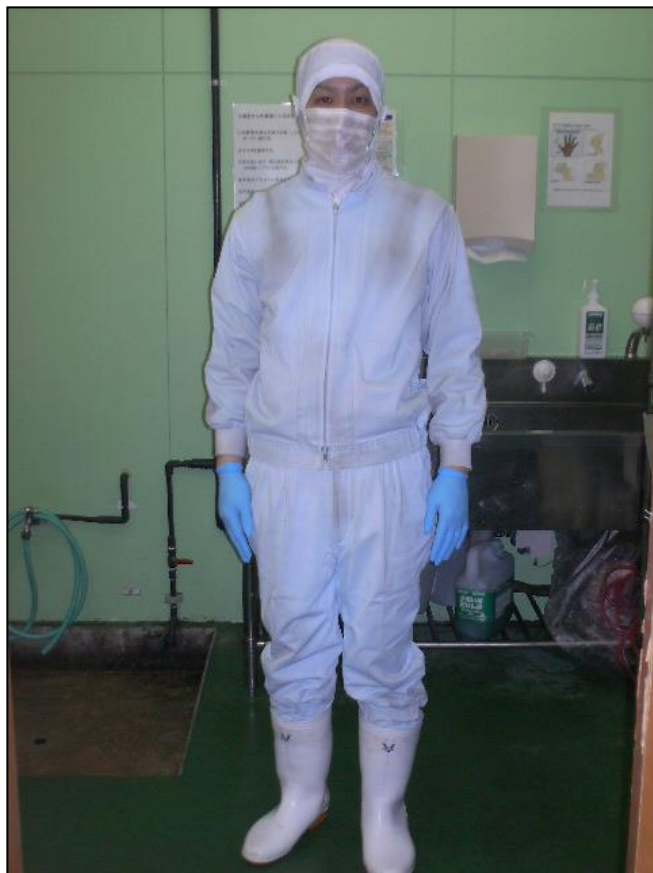
加工場入場前イメージ